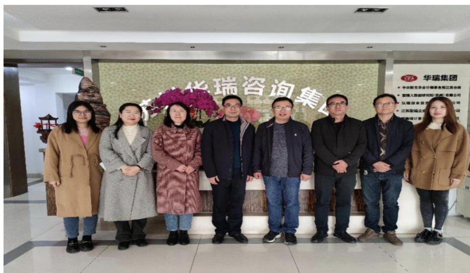
图2苏州信息职业技术学院走访苏州华瑞

双向深度调研，奠定方案修订的实证基础。我司积极合并主导了系列调研活动。一方面，热情接待并精心安排苏信学院教学团队多次来我司及客户单位进行实地调研，通过组织业务骨干座谈会、开放典型工作岗位观摩、提供岗位能力分析资料等方式，使学校教师直观、深刻地理解会计、审计、税务等领域在数字化变革下的真实业态、技术应用与能力缺口。另一方面，我司管理层及资深专家应校方邀请，积极参与贵系组织的人才培养方案专题研讨与论证会。在会议上，我司代表基于一线业务数据、客户反馈及行业发展趋势，系统阐述了当前市场对财经类专业人才的能力期望，并对未来人才需求规模与结构进行了研判。