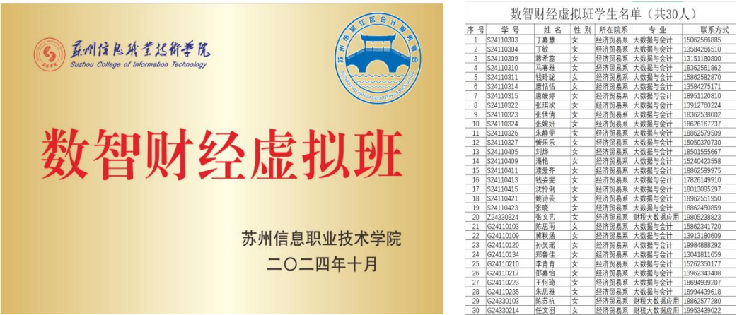
图 5 数智财经虚拟班学生名单

不仅融入了我司的真实项目案例与数字化工具，还引入了协会会员单位的多元实务场景；继续推行校企“双导师”制，由我司及协会专家共同提供指导；考核评价持续强化实战导向，注重学生解决真实业务问题的综合能力。通过构建“协会牵头、企业主导、校中有企、课岗融合”的育人新生态，虚拟班有效实现了教学内容与行业前沿、学习过程与工作实践、学业标准与职业发展的高度统一，为学生向数字化财经人才的转型奠定了坚实基础，也为区域行业协作育人探索了新模式。