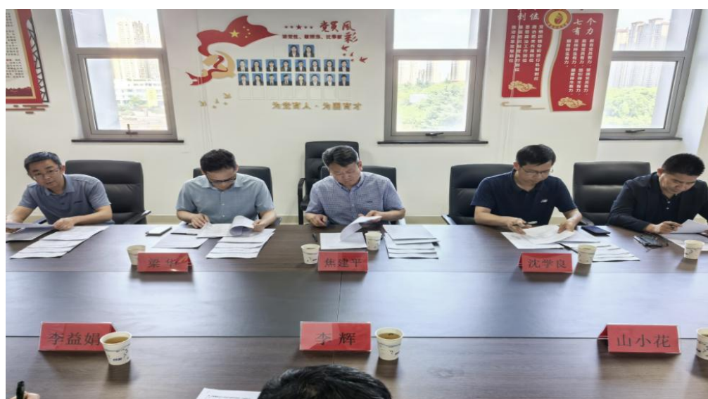
图3 参与2025级人才培养方案修订专家论证会

在审阅贵系大数据与会计、大数据与审计、财税大数据应用专业人才培养方案草案时，我司专家团队结合业务实践，提出了具体而关键的建议，并推动了方案的实质性优化。例如：强化数据分析能力课程，我们明确指出，传统核算技能已无法满足智能财务时代需求，必须将财务数据分析能力作为核心素养进行培养。据此，建议增设或强化《大数据财务分析》等课程，并提供了我司实际业务中使用的数据分析场景与模型作为教学案例参考。夯实审计实务核心技能：针对毕业生在审计岗位上岗适应期较长的问题，我们强调规范化、数字化审计工作底稿的编制能力是关键。为此，我们建议在相关课程中嵌入由我司审计经理主导的“智能审计底稿实务”专项训练模块，并承诺提供我司真实的、脱敏后的底稿模板与编制规程，作为教学资源。优化课程体系与内容衔接：我司专家还对课程设置的先后逻辑、理论教学与项目实践的比例、职业资格证书与课程内容的融合点等提出了细致建议，确保培养方案既符合教育规律，又紧贴职业标准。