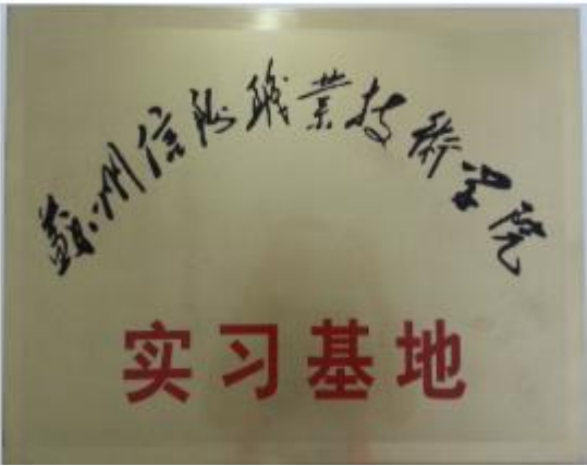
图 7 苏州华瑞实训基地建设